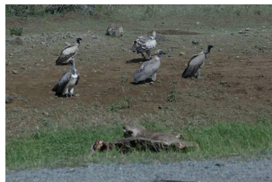
gieren bij prooi