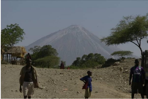
Oldonyo Lengai, berg met sodakristallen

uitgeworpen heeft. De uitgeworpen lava is minder heet (i.p.v. 1100 graden nog maar 500 graden Celsius). Daardoor is de lava dun, en kan snel stollen, waardoor in de krater laagjes, een soort flensjes, ontstaan. De regen spoelt de soda uit, zodat de top eruit ziet of hij met sneeuw is bedekt. Ook is de berg door eerdere stollingen steiler van vorm dan vulkanen elders.