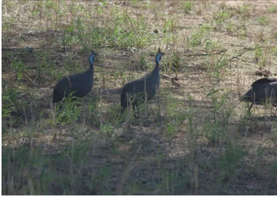
de parelhoen, bijdrage van Afrika