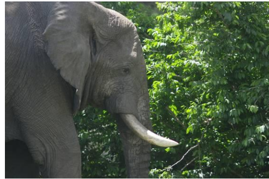
Afrikaanse olifant, te herkennen aan zijn oren

We vergaapten ons aan Afrikaanse olifanten (waarvan de oren hun afkomst verraden), Masai-giraffen (met een iets donkerder kleur), struisvogels (die niet kunnen vliegen maar wel hard lopen; lijken op de vroegere dinosaurussen), zebrahamoesten (komische groepsdiertjes die af en toe kaarsrecht omhoog gaan staan om de omgeving af te speuren), families van meerkatten, blauwapen en bavianen die rustig elkaar aan het ontvlooien zijn, grazende wratten- en boszwijnen, gazelles en impala's, waterbokken en bijzondere vogels zoals de gier en de barbet (soort specht) en nog veel meer (waaronder op een afstand een cheetah).