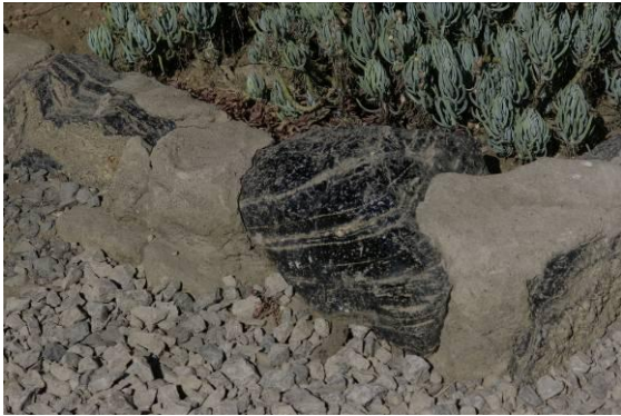
obsidiaan, glasachtig steen

Vuistbijlen kun je niet overal aantreffen, omdat voor een goede bijl goed materiaal (= steen) nodig is. Vulkanen leveren goed materiaal, zoals trachiet en basalt en vooral het zwarte glasachtige obsidiaan.