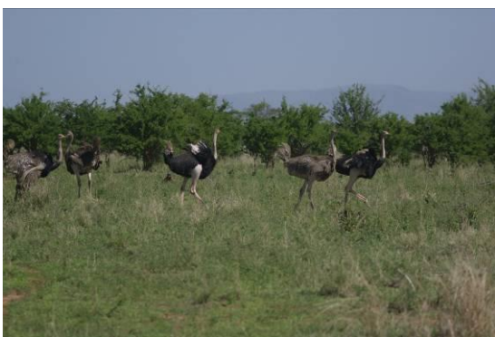
struisvogels (zie gelijkenis met dino's)

We vergaapten ons aan Afrikaanse olifanten (waarvan de oren hun afkomst verraden), Masai-giraffen (met een iets donkerder kleur), struisvogels (die niet kunnen vliegen maar wel hard lopen; lijken op de vroegere dinosaurussen), zebrahamoesten (komische groepsdiertjes die af en toe kaarsrecht omhoog gaan staan om de omgeving af te speuren), families van meerkatten, blauwapen en bavianen die rustig elkaar aan het ontvlooien zijn, grazende wratten- en boszwijnen, gazelles en impala's, waterbokken en bijzondere vogels zoals de gier en de barbet (soort specht) en nog veel meer (waaronder op een afstand een cheetah).