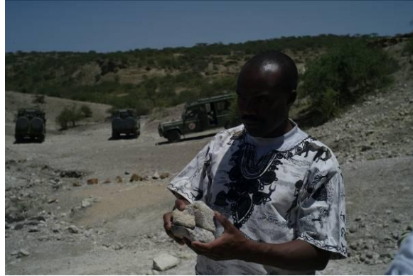
vindplaats Olduvay Gorge, cradle of mankind