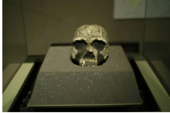
Schedel van Homo rudolfensis ?

We stammen dus niet rechtstreeks af van de chimpansee, zoals algemeen wordt gedacht. Wij hebben immers geen grote hoektanden, het symbool van agressie. Maar er is wel verwantschap, omdat wij geëvolueerd zijn uit de lijn van de zoogdieren (i.t.t. de lijn van reptielen, vogels en vissen), en wel specifiek uit de lijn van primaten die al 65 miljoen jaar geleden bestonden. Daarmee zijn adaptaties te vinden, maar ook verschillen. Kortom: de mens heeft meer dan één oorsprong.