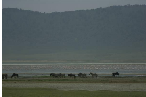
midden in de Ngorongoro caldera

Ook de spectaculaire Ngorongoro caldera in Noord Tanzania (let op: dit is geen krater want die is met as gevuld, en een caldera is met puin bedekt) is niet alleen bijzonder vanwege alle gebruikelijke Afrikaanse wilde dieren die er doorheen lopen, maar ook vanwege de ongeschonden randen van de caldera; met zo'n 20 km doorsnee een uiterst imposante kom vormend. Onze lodge lag op de rand met een onvergetelijk weids uitzicht.