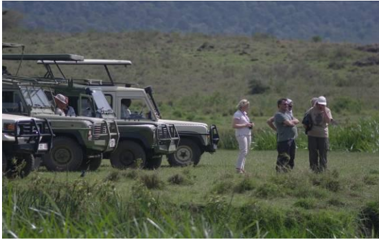
Het vervoer met Land Rovers