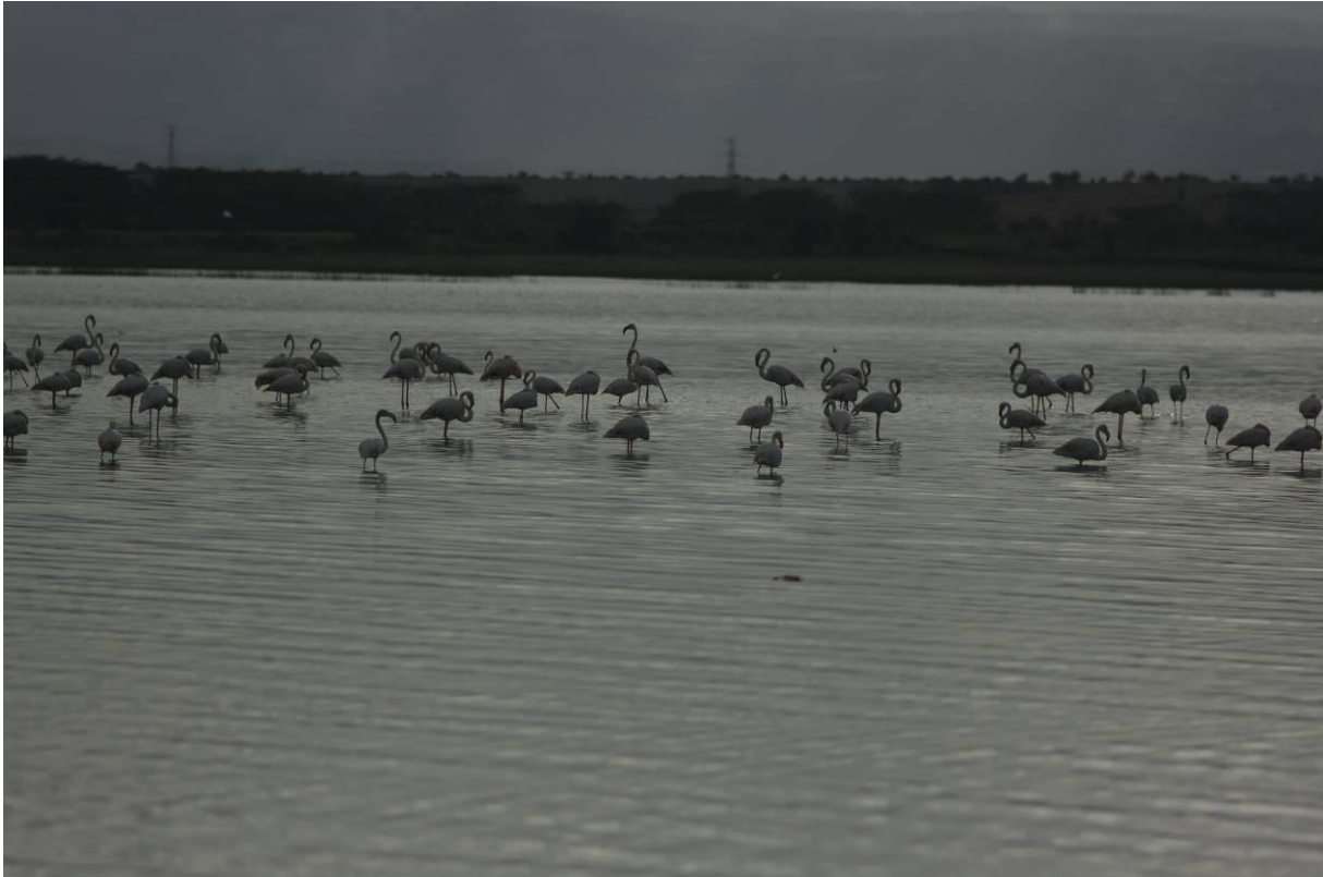
flamingo's in meer bij Naivasha

Deze scheur loopt van de Dode Zee dwars door Afrika. In Ethiopië splitst deze zich in tweeën, waarbij de westelijke tak langs Rwanda en Burundi uiteindelijk naar Mozambique loopt. De oostelijke tak loopt door Kenia en Tanzania. Hij is zo'n 7000 km lang en tussen de 50 en 170 km breed, met een diepte van 600 tot 900 meter. Vanwege zijn ouderdom is Afrika tamelijk vlak, behalve langs deze Rift, die is ontstaan door barsten in de aardkorst.