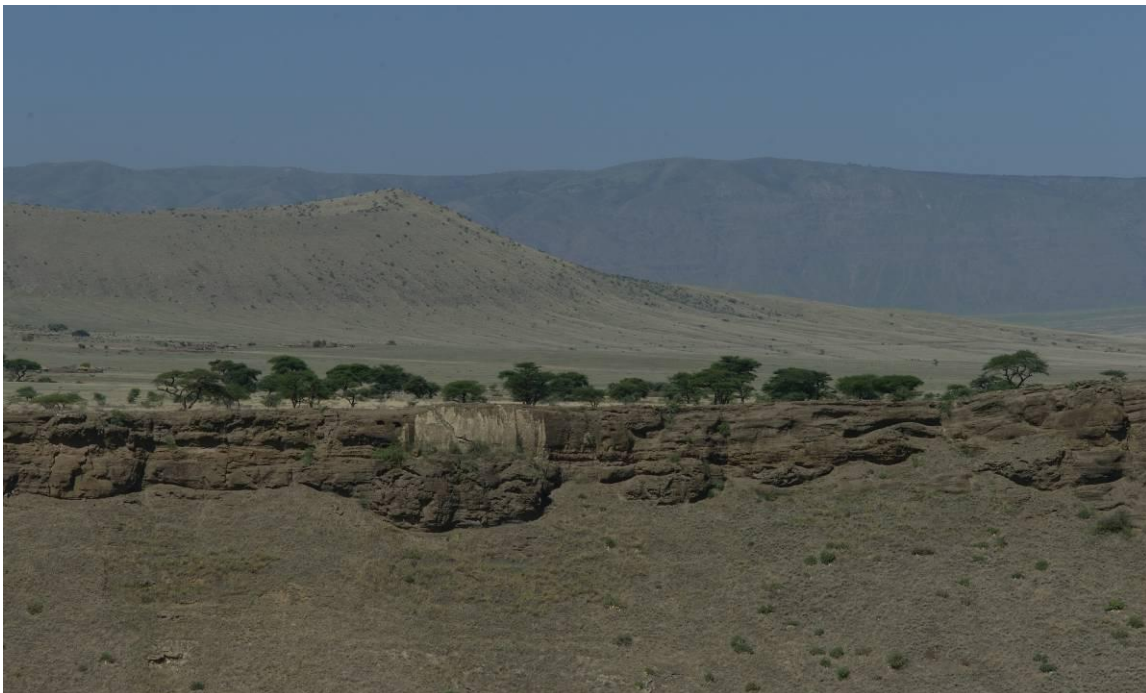
Breuk van de Rift Valley

Het deel van Afrika dat wij hebben bezocht, was aan de oostelijke tak van de Rift Valley, oftewel de Grote Slenk in Oost Afrika, zo'n 40 miljoen jaar geleden ontstaan door radiaire breuken, escarpements ofwel scheuren die tot de aardkorst reiken (tot wel 15 km diep).