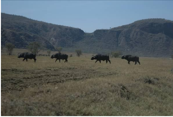
buffels in Hell's Gate National Park