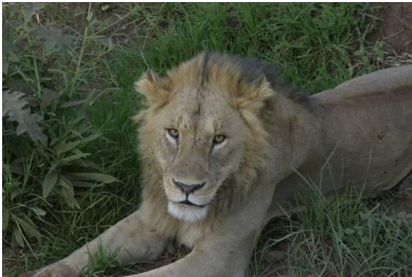
een lieve leeuw, maar o zo gevaarlijk

Al deze dieren (naast de andere megafauna als leeuwen, buffels, zebra's, wildebeesten oftewel gnoes, neushoorns en nijlpaarden die we op andere dagen hebben gezien) vormden ooit de levende omgeving van de oermens!