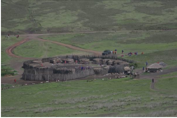
Masai dorp in een verweerd landschap