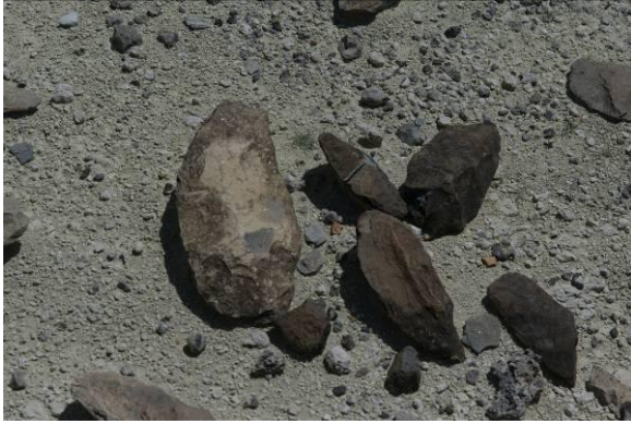
Vuistbijlen en schrapers, Olorgesailie (Kenia)