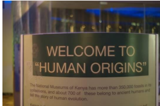
welkomstbord nationaal museum Nairobi

Na een tocht met Land Rovers over een redelijk goede weg van zo'n 80 km kwamen we aan in het Tarangire Nationaal Park. We reden door een spectaculair landschap met her en der Masai herders met hun kudden geiten, schapen of koeien.