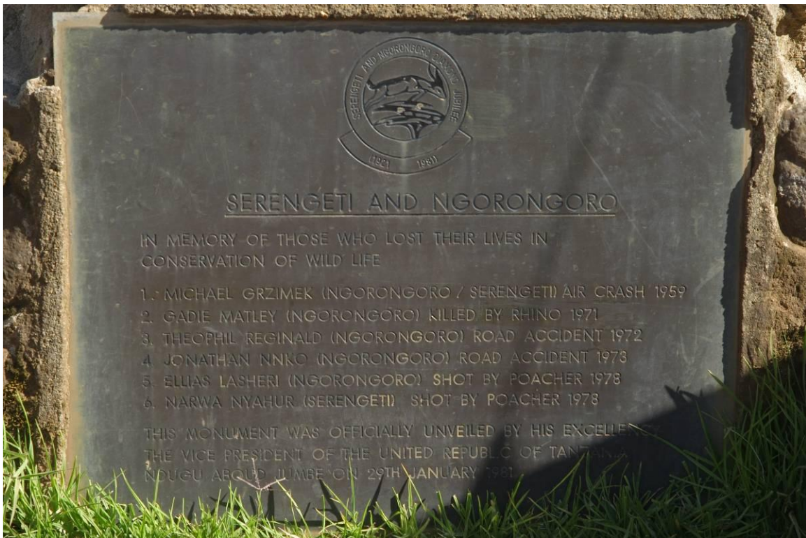
Gedenkteken voor vader en zoon Grzimek in Ngorogoropark

Door de overbegrazing wordt de savanne nog verder uitgeput. Dat er nog 'wild-life' en natuur is, hebben we onder andere te danken aan de Duitse pioniers Bernard en Michael Grzimek, vader en zoon, die in de vorige eeuw hun leven voor de preservatie van het 'wild-life' hebben gegeven.