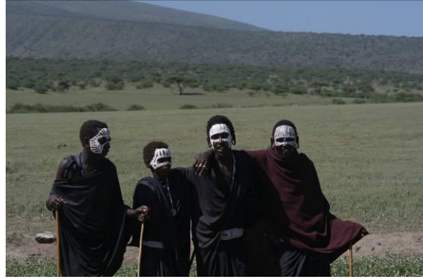
net besneden Masai-jongens

Door de overbegrazing wordt de savanne nog verder uitgeput. Dat er nog 'wild-life' en natuur is, hebben we onder andere te danken aan de Duitse pioniers Bernard en Michael Grzimek, vader en zoon, die in de vorige eeuw hun leven voor de preservatie van het 'wild-life' hebben gegeven.