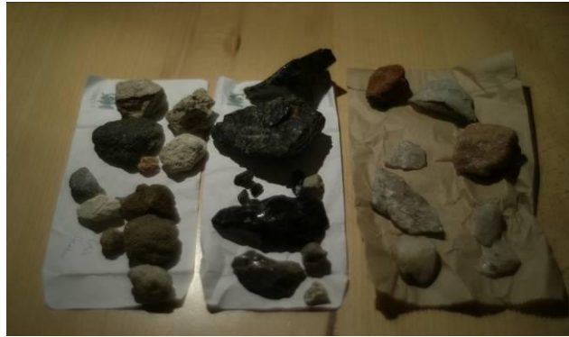
soorten steen, waaronder basalt, vuursteen, kwarts en puimsteen

Dat materiaal werd bijvoorbeeld ook gevonden in de Olduvai Gorge in Tanzania, maar ook in Kariandusi, in Kenia. In Nederland zijn ook vondsten gedaan van vuistbijlen van Neanderthalers. Deze gebruikten vooral vuursteen, dat met de rivieren en gletsjers vanuit het noorden is meegekomen.