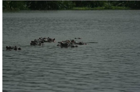
slapende hippo's, maar o zo gevaarlijk

Moe van het kijken en foto's maken, werden we naar ons verblijf gereden. Daar werden we verwelkomd met een warm nat doekje om het alom aanwezige stof van ons gezicht te vegen, en met een watermeloendrankje om onze keel te verfrissen. Nadat onze koffers naar onze 'tented lodge' waren gebracht, konden we vanuit onze terrasstoelen met een verfrissend Kilimanjaro biertje van ons geweldige uitzicht over de vallei met de vele fauna genieten.