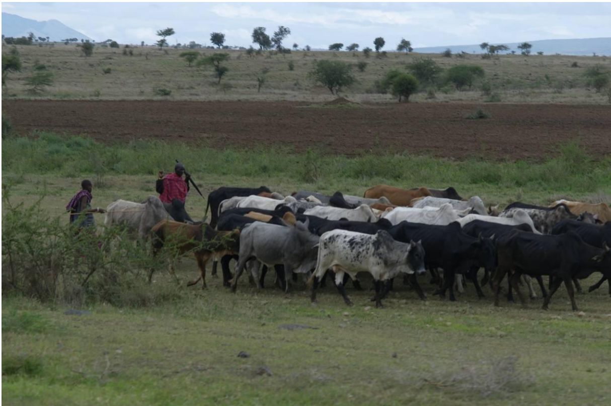
Masai herders met koeien

Na een tocht met Land Rovers over een redelijk goede weg van zo'n 80 km kwamen we aan in het Tarangire Nationaal Park. We reden door een spectaculair landschap met her en der Masai herders met hun kudden geiten, schapen of koeien.